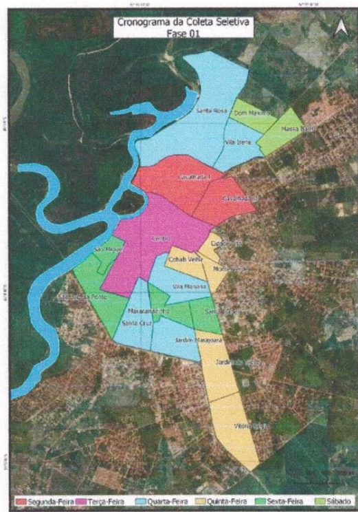
Figura 3 - Mapa da rota da coleta seletiva da Fase 1.

Atualmente, são atendidos os seguintes bairros na execução da Fase 1 da coleta seletiva porta a porta: Cavallhada I, Cavallhada II, Centro, Cidade Alta, Cohab Velha, Dom Máximo, Jardim São Luiz da Ponte, Jardim do Trevo, Maracanãzinho, Monte Verde, Massa Barro, Santa Cruz, Santa Isabel, Santa Rosa, São Miguel, Vila Mariana, Vila Irene e Vitória Régia.