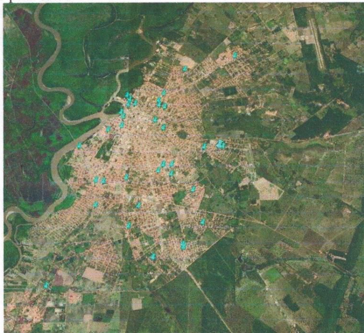
Figura 5 - Distribuição dos contêineres na área urbana de Cáceres/MT.

Desse modo, os contêineres verdes serão coletados pela coleta seletiva, enquanto que os contêineres marrons serão coletados pelos caminhões de lixo da coleta regular. Os materiais descartados nos contêineres serão observados e monitorados pela Autarquia Águas do Pantanal e conforme necessidade os dispositivos poderão ser realocados para melhor atendimento à coleta seletiva. A seguir estão os locais que possuem contêineres instalados estrategicamente para este fim: