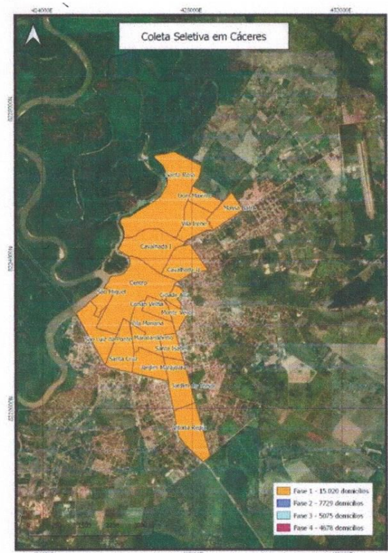
Figura 1 - Mapa de abrangência da Fase 1 da coleta seletiva na cidade de Cáceres/MT

Associação de Catadores de Materiais Recicláveis de Cáceres – MT