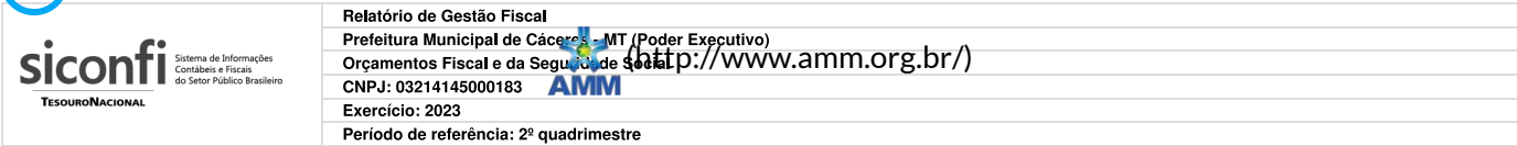
RGF-Anexo 01 | Tabela 1.0 - Demonstrativo da Despesa com Pessoal