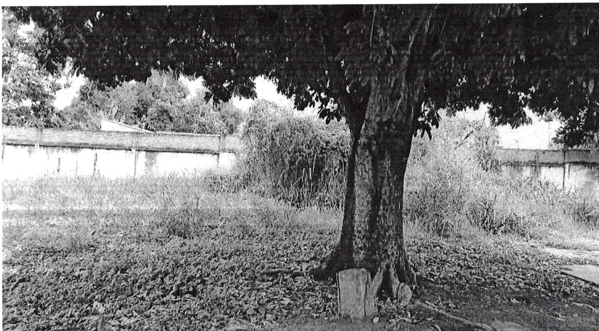
Fotos do Terreno da Escola Municipal Buscando o Saber , quadra e arredores.