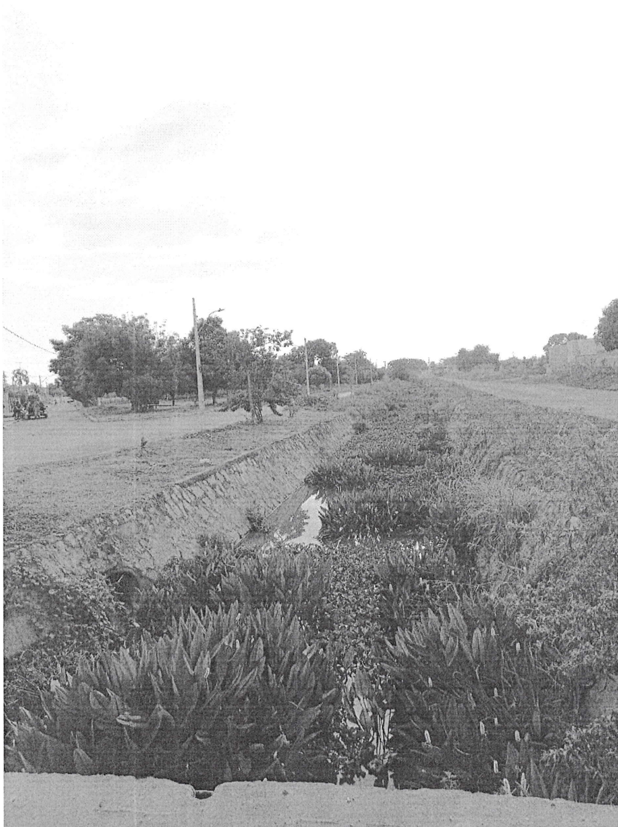
Imagem do Canal do Renato