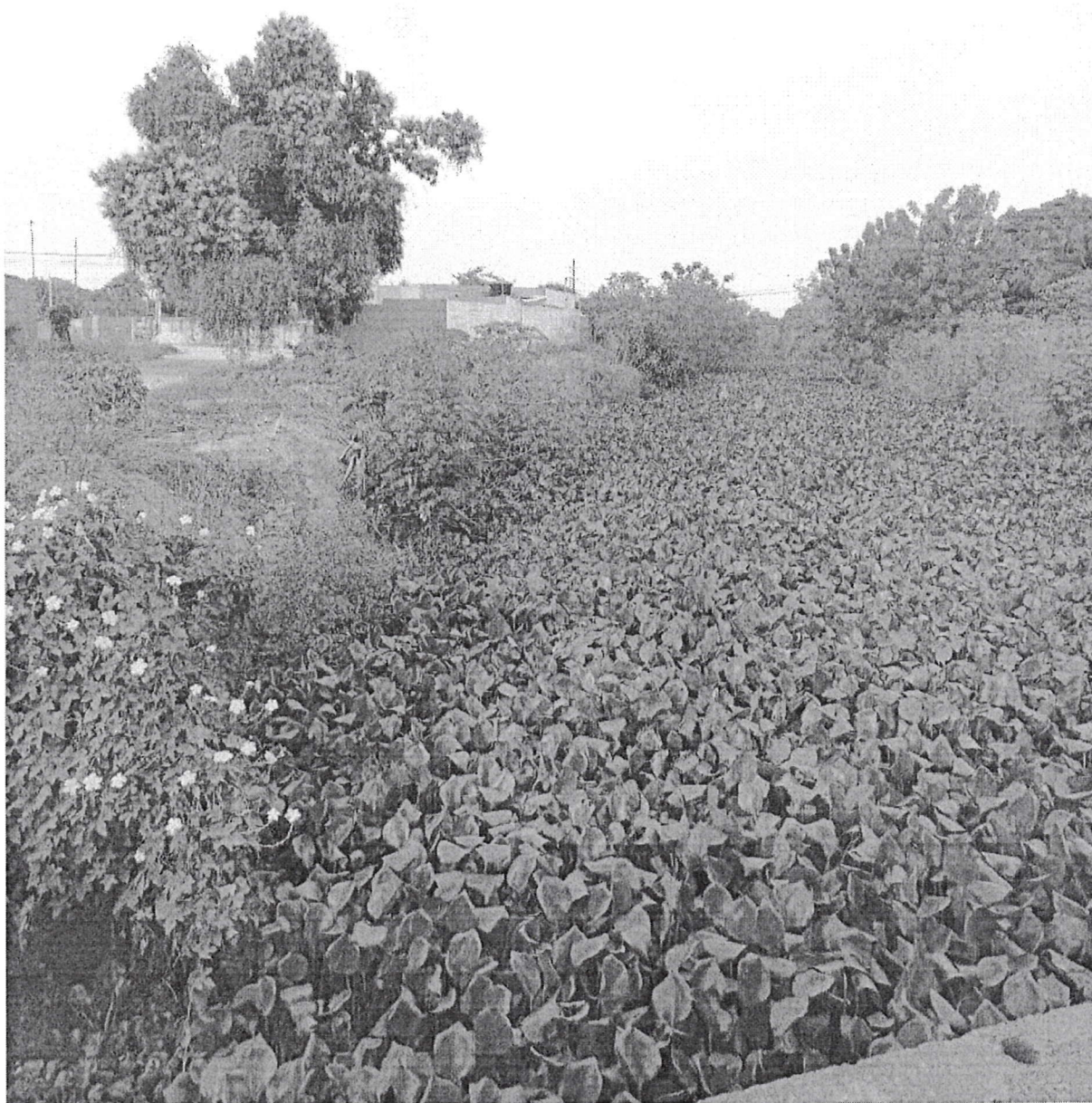
Imagem do Canal do Renato