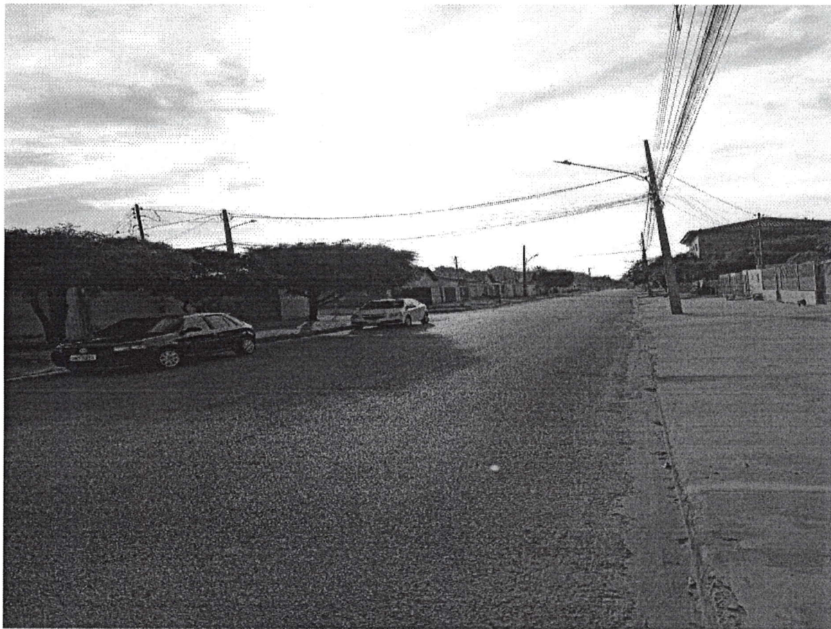
Rua dos Macucos